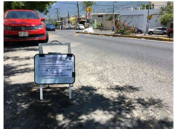
Cadenamiento 0+239. Desprendimiento de agregados.