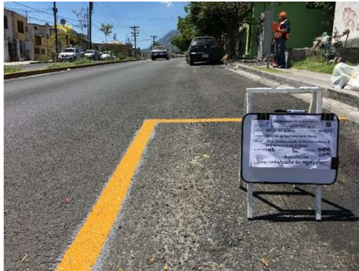
Cadenamiento 0+145. Desprendimiento de agregados.