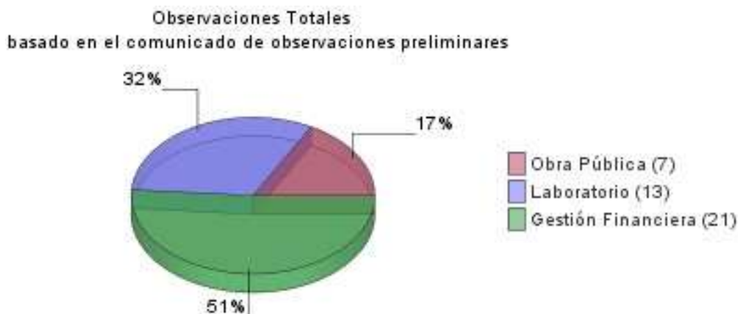
GRÁFICA: Observaciones preliminares detectadas en la revisión por tipo de auditoría

A continuación se presenta el resumen de las observaciones preliminares detectadas durante la revisión, clasificadas por tipo de auditoría.