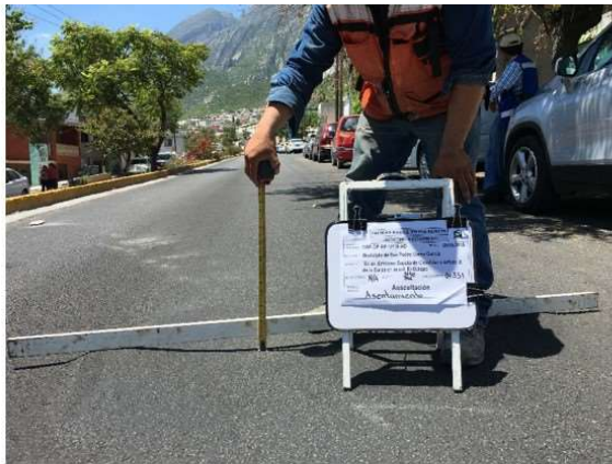
Cadenamiento 0+351. Asentamiento.

La clasificación de los tipos de deterioros y el nivel de severidad de los mismos fueron asignados de acuerdo a las siguientes referencias bibliográficas: SCT, IMT, "Catálogo de deterioros en pavimentos flexibles de carreteras mexicanas", 1991, Publicación técnica No. 21, Querétaro. Y FHWA, U.S. Department of Transportation, "Distress identification manual for the Long-Term Pavement Performance Program", 2003, Publications No.FHWARD-03-031.